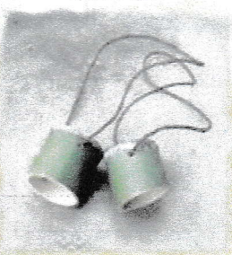
竹ぼっくりを作ってみよう