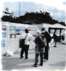
フォトコンテスト投票会