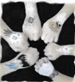
ポティペイント体験