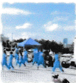
ダンス&バーカッションセッション