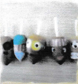
どんぐりであそぼう